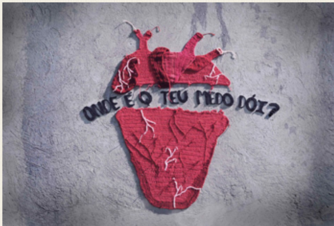
Figura 1 - Visceral