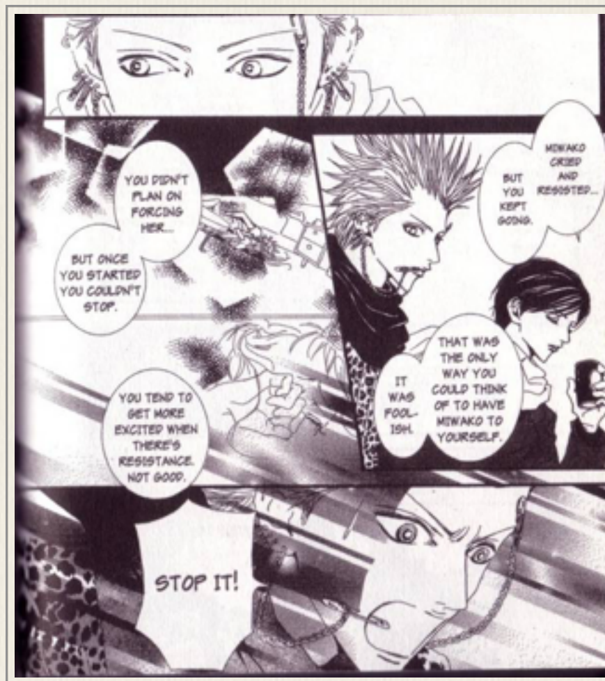
Paradise Kiss , vol. 5, cap. 44

entre os dois rapazes é revelado que o namoro do casal começou com um estupro. Tudo isso acontece no último volume da série, o quinto, e foi igualmente uma surpresa para os leitores.