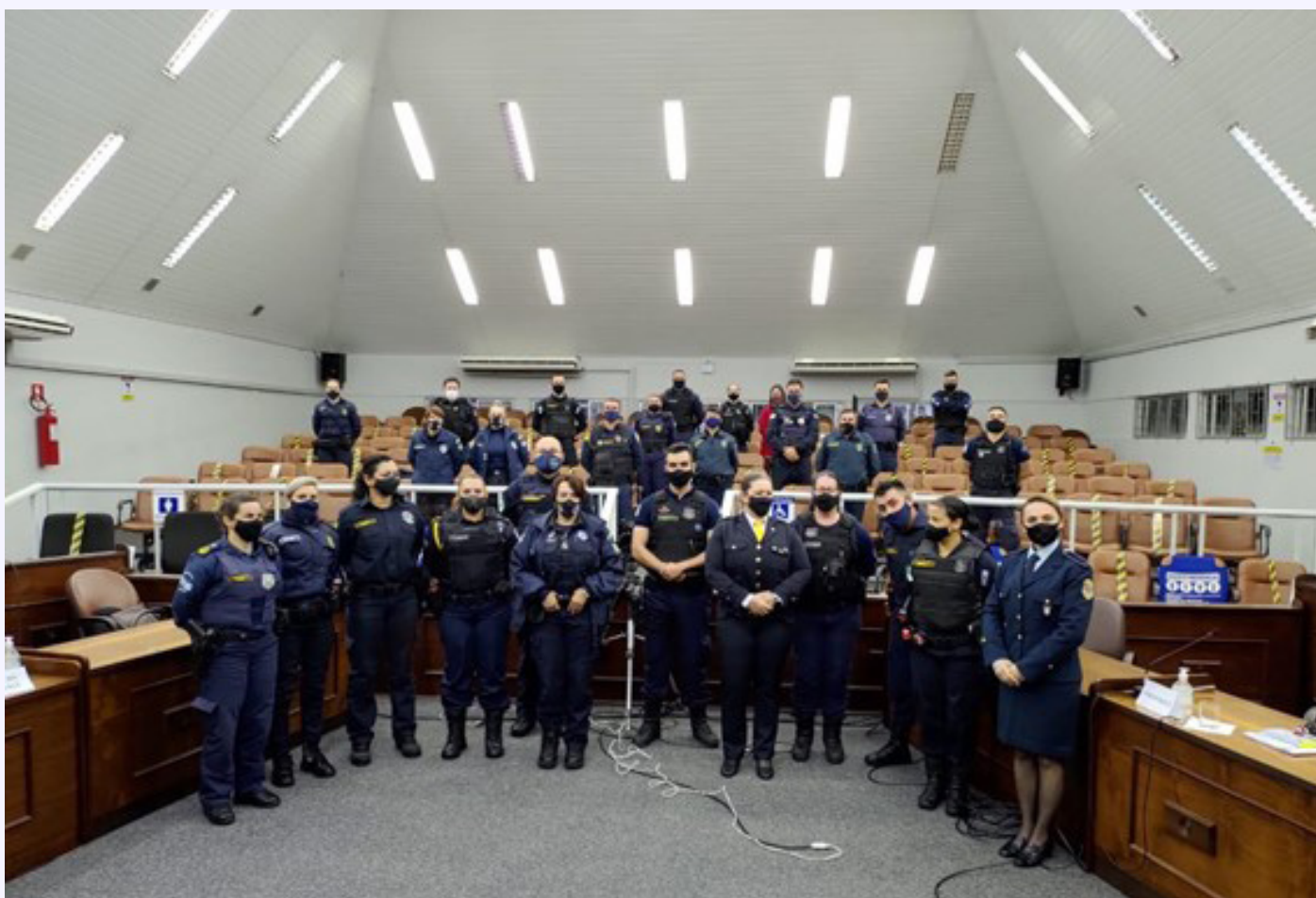
1º Encontro de Patrulhas no Paraná

A Patrulha Maria da Penha está de prontidão, pois nenhuma mulher deve viver este problema sozinha: todos nós somos responsáveis pelas mulheres em situação de violência.