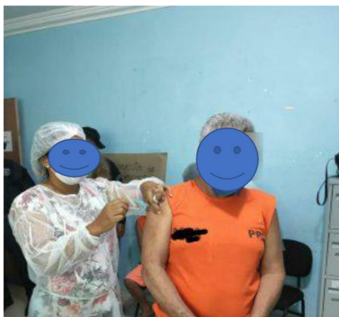
Campanha da vacina para privados de liberdade com o acompanhamento do Conselho da Comunidade