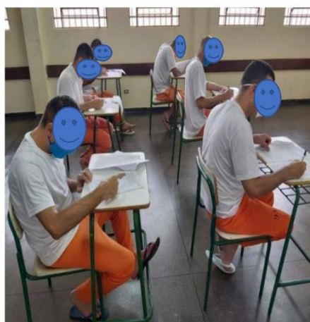
Projeto de Remição de pena pela leitura na prisão desenvolvido pelo Conselho da Comunidade e parceria DEPPEN