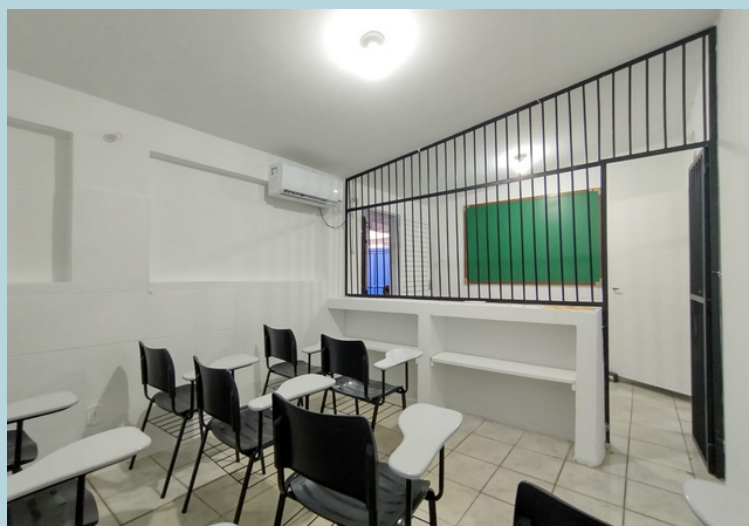
Sala de aula entregue para a Cadeia Pública de MCR