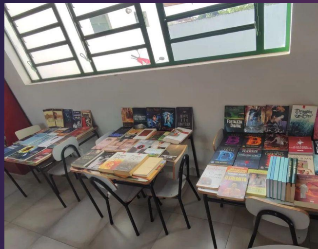
75 livros doados a biblioteca cidadã da cidade, que também nos ajudou com livros no nosso início 🌟