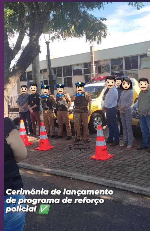
Cerimônia de lançamento de programa de reforço policial ✓

Esse reforço policial visou aumentar nosso policiamento, e conseqüentemente a segurança da nossa Comarca, marco importante para a cidade, onde o Conselho esteve presente se disponibilizando com parcerias.